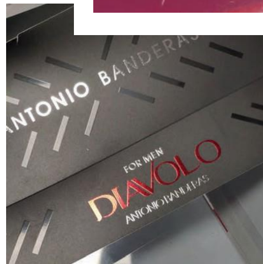
COLD STAMPING ROJO Y BARNIZ BRILLO