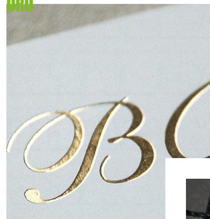
COLD STAMPING ORO