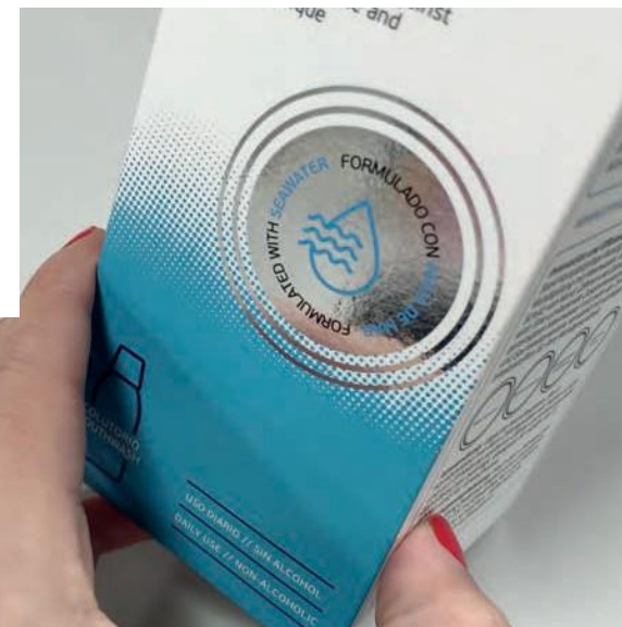
COLD STAMPING PLATA MÁS CUATRICROMÍA